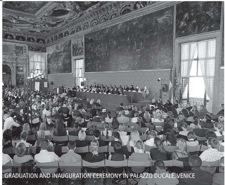
GRADUATION AND INAUGURATION CEREMONY IN PALAZZO DUCALE, VENICE